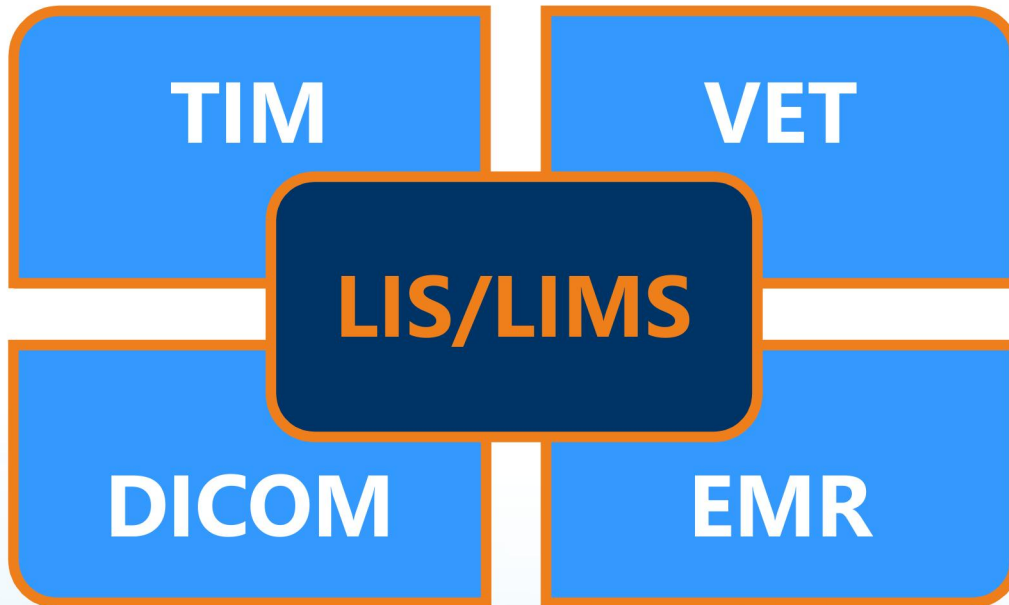
Imagen digital y comunicación